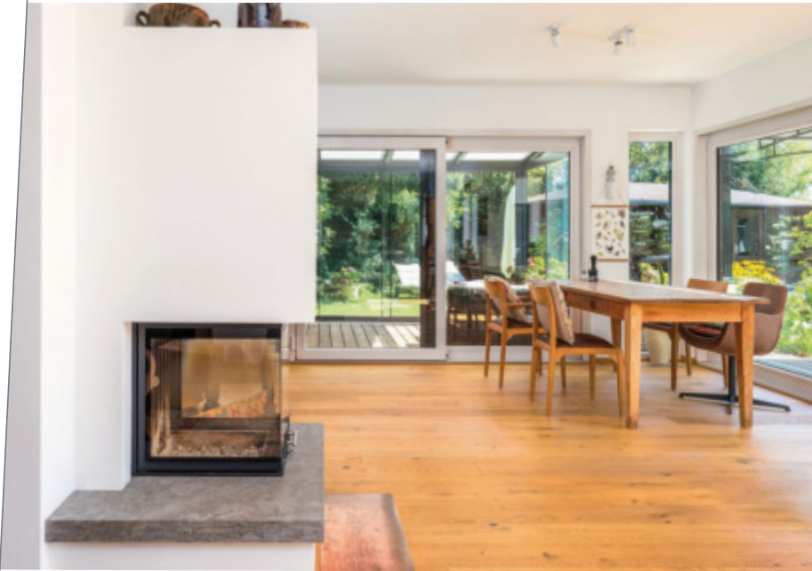
Große Panoramafenster und der angrenzende Wintergarten verbinden drinnen mit draußen.

unten links: In der Küche ergänzen sich dunkle Fronten, Holzverkleidung an den Wänden und eine Arbeitsplatte aus Marmor perfekt.