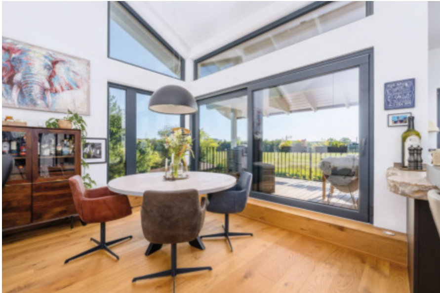
Im Wohn- und Essbereich harmonisieren helles Holzpaket und Vintage-Möbel miteinander.